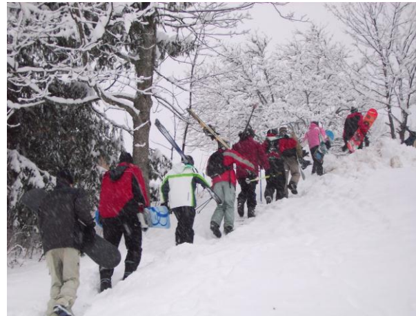
Abiturvorbereitung im Schnee